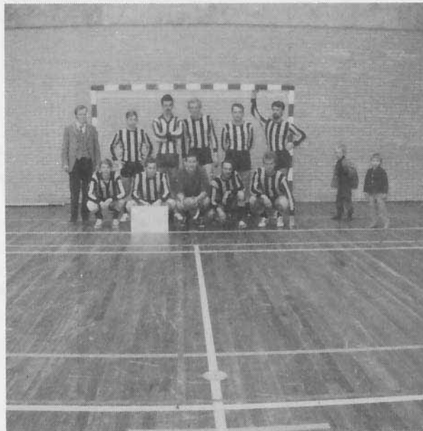
De eerste kampioen d.d. 21-2-1971