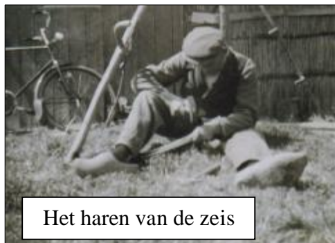
Het haren van de zeis

Bij gebruik wordt het mes natuurlijk bot. Om het tussen door aan te zetten (te scherpen) wordt de strekel gebruikt. Dit is een lat met aan beide zijden amarilpoeder, een slijppoeder, wat de bramen van het snijvlak verwijdert. Na veelvuldig gebruik wordt het noodzakelijk om de zeis goed te scherpen. Dit gebeurde met een haarspit en een haarhamer. Een haarspit is een soort mobiel aambeeldje dat in de grond geplaatst werd en met een haarhamer werd het snijvlak dun geslagen. Als dit goed gedaan was, werd de zeis weer 'haarscherp'.