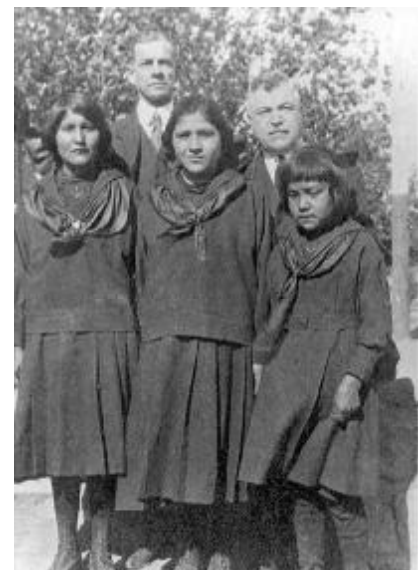
Beets, linksboven bij de Navajo missie Rehoboth in New Mexico Datum onbekend.