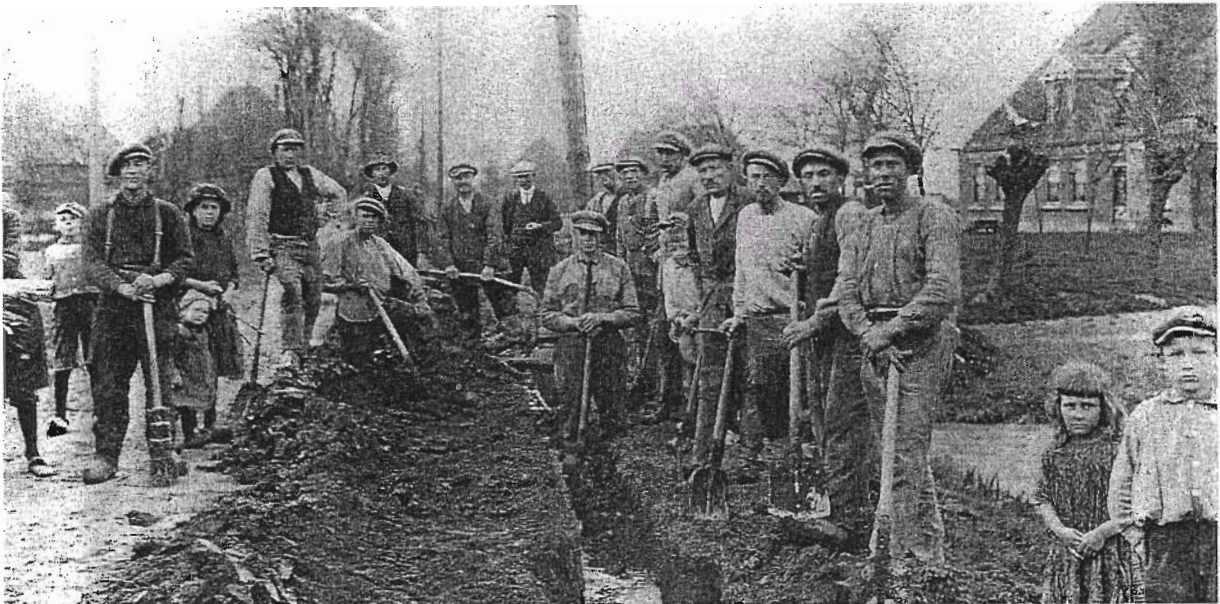
Aanleg van een waterleiding

In 1919 werd door het Provinciaalbestuur van Noord-Holland een waterleidingbedrijf opgericht om iedere inwoner van hygienisch betrouwbaar drinkwater te voorzien. Hiertoe werden bestaande bedrijven als Zaandam en Alkmaar door de provincie opgekocht en uitgebreid. De doelstelling was een buizenet aan te leggen waarop elk woonhuis een aansluiting zou moeten nemen. Niet elke inwoner van een gemeente stond te trappelen om een aansluiting op een waterleiding. Men beschikte veelal over voldoende regenwater en een enkeling had een bronwaterinstallatie (in de volksmond nortonwater genoemd). Pas toen het gemeentebestuur in haar verordening had opgenomen dat er een aansluitplicht was, ging het waterleidingbedrijf over tot aanleg van een buizenet. Een en ander werd bespoedigd door de buitengewoon droge weersgesteldheid van 1921. In de duinen bij Bergen was al een productie pompstation gebouwd. Hier werd duinwater opgepompt, gezuiverd en het buizenet in gepompt. April 1924 werd er overeenstemming bereikt met de gemeente Koedijk voor de aanleg en reeds in de maand november 1924 kwam de hoofdaanvoerleiding gereed tussen Alkmaar en het pompstation te Bergen. Deze leiding werd gelegd langs de Oostelijke Kanaaloever naar Schoorldam. De doelstelling was om de bedrijfszekerheid voor de waterlevering aan Alkmaar en Den Helder te vergroten. Bovendien werd met deze leiding de voorziening van de kom der gemeente Koedijk tot stand gebracht.