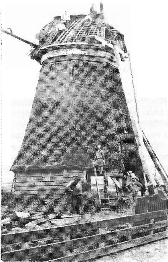
De molen van Bos voor de sloop..