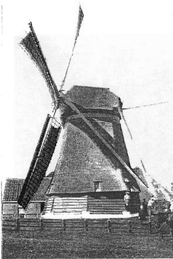
De sloop is begonnen, april 1929