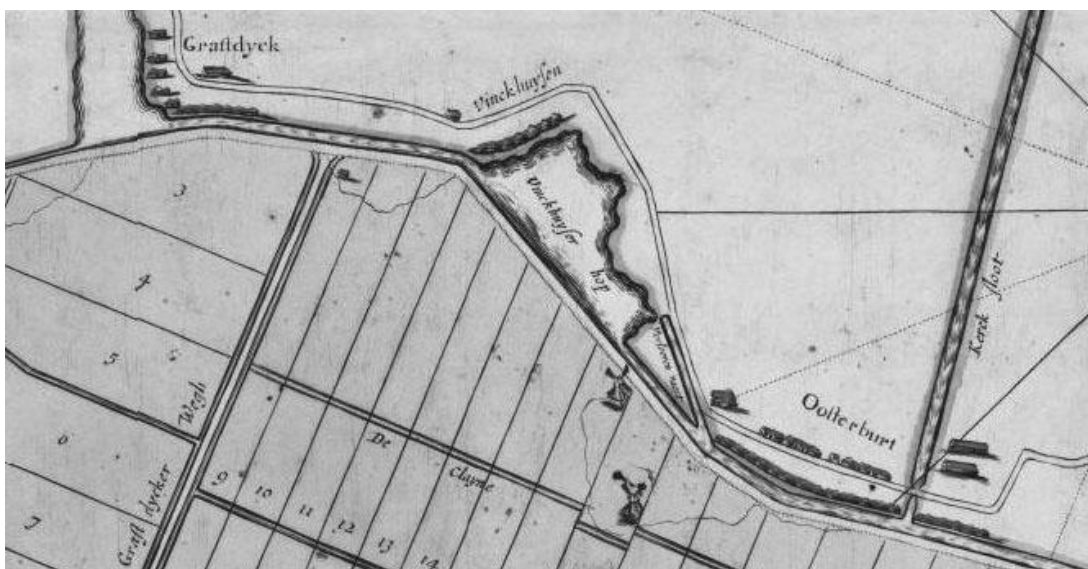
Detail kaart van de Starnmeer uit 1658 met de Wester- en de Oosterbuurt van Graftdijk