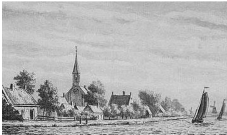
Oost-Graftdijk met de later gebouwde kerk