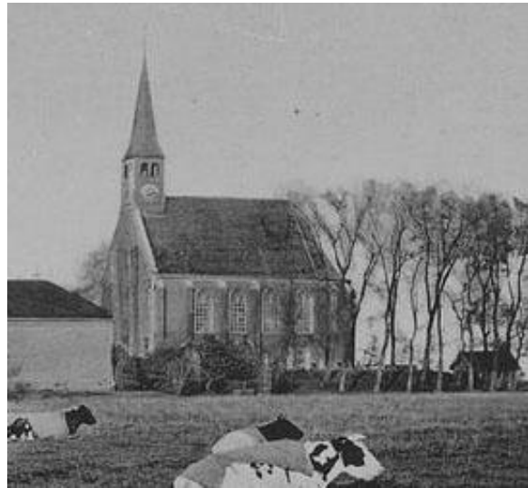
Later gebouwde kerk van West-Grafdijk