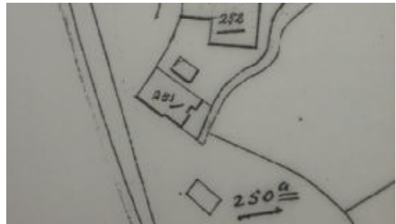
Situatie in 1821 met B0251