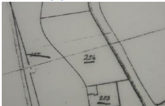
Situatie in 1821 met B0254