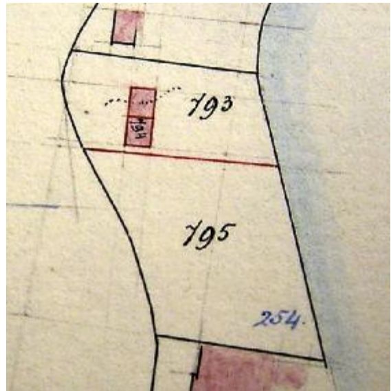
1902 splitsing en stichting