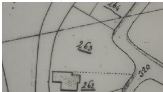
Situatie in 1821 met B0263