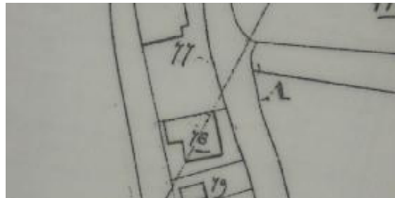
Situatie in 1821 met A0078