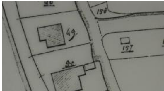
Situatie in 1821 met A0157