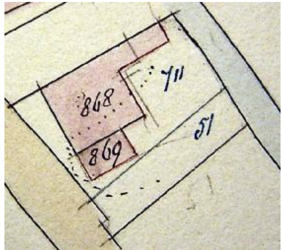
1896 sloping, stichting en splitsing

-omschrijving: huis en erf -huurwaarde gebouw(en): f 21,=/f 50,= -perceel: A0051 – oppervlakte: 390 m 2 -1896 sloping, stichting en splitsing