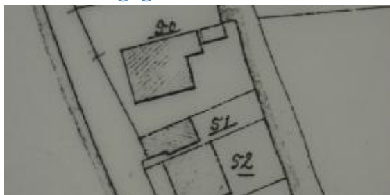
Situatie in 1821 met A0051