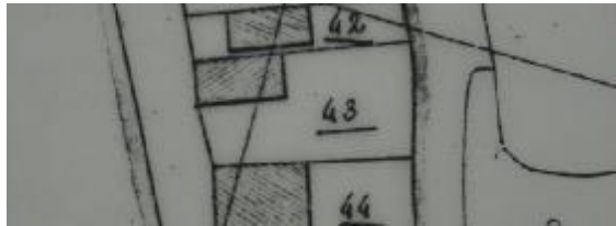
Situatie in 1821 met A0043