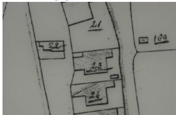
Situatie in 1821 met A0023