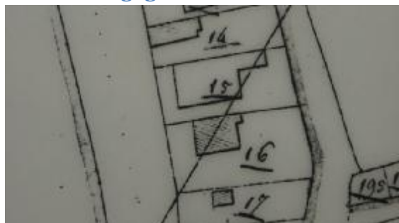
Situatie in 1821 met A0016