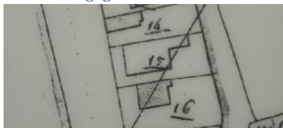
Situatie in 1821 met A0015