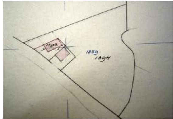
Situatie in 1927