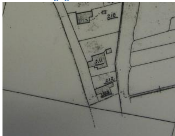
Situatie in 1821