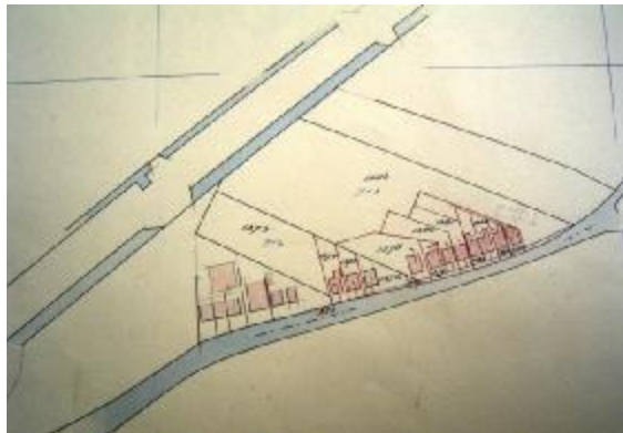
Situatie in 1937