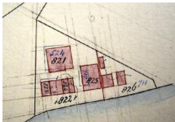
1903 stichting en splitsing