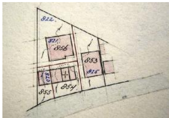
1905 bijbouw en vereniging